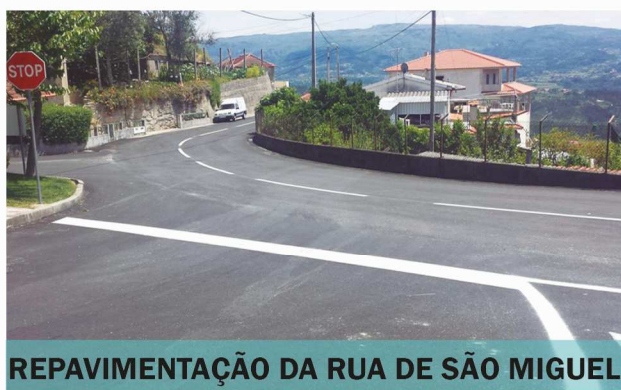
REPAVIMENTAÇÃO DA RUA DE SÃO MIGUEL