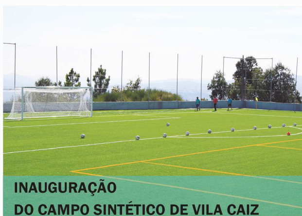
INAUGURAÇÃO DO CAMPO SINTÉTICO DE VILA CAIZ