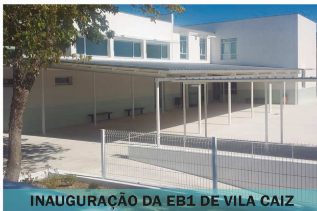
INAUGURAÇÃO DA EB1 DE VILA CAIZ