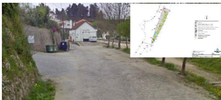
PAVIMENTAÇÃO DA ESTRADA DE VILARINHO VAI CONCRETIZAR-SE