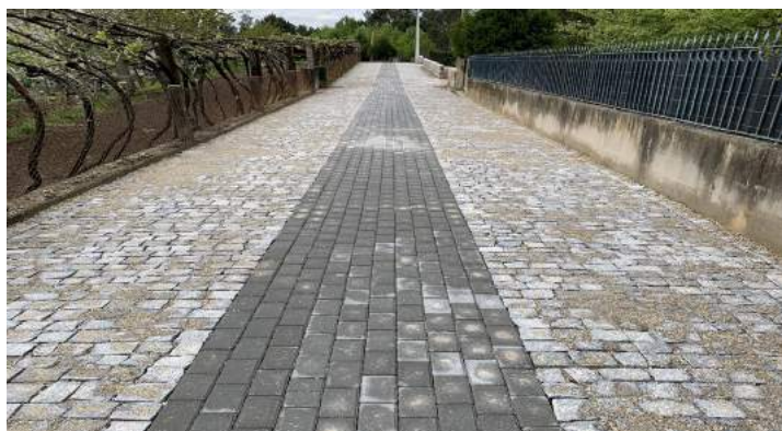
INTERVENÇÃO VALORIZOU PAVIMENTAÇÃO NA RUA PICADEIRO