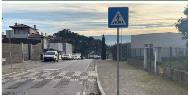
PASSADEIRAS E ALARGAMENTO PASSEIO PARA MAIOR COMODIDADE JUNTO IGREJA