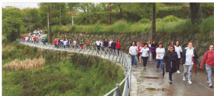
COMEMORAÇÃO DO 25 ABRIL