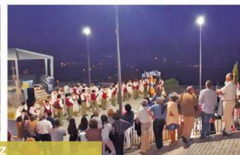
SARAU CULTURAL EM VILA CAIZ