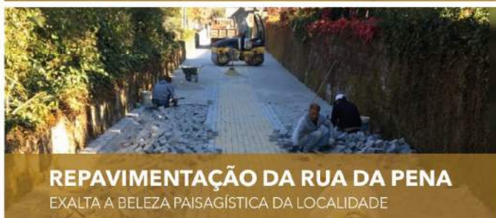
REPAVIMENTAÇÃO DA RUA DA PENA EXALTA A BELEZA PAISAGÍSTICA DA LOCALIDADE