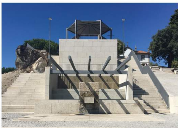
OBRAS DE REQUALIFICAÇÃO DÃO VIDA À SENHORA DA GRAÇA