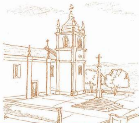
ÁREA DE REABILITAÇÃO URBANA DE VILA CAIZ