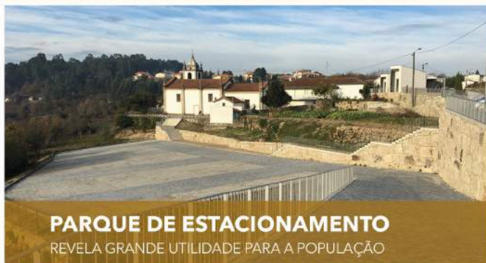
PARQUE DE ESTACIONAMENTO REVELA GRANDE UTILIDADE PARA A POPULAÇÃO