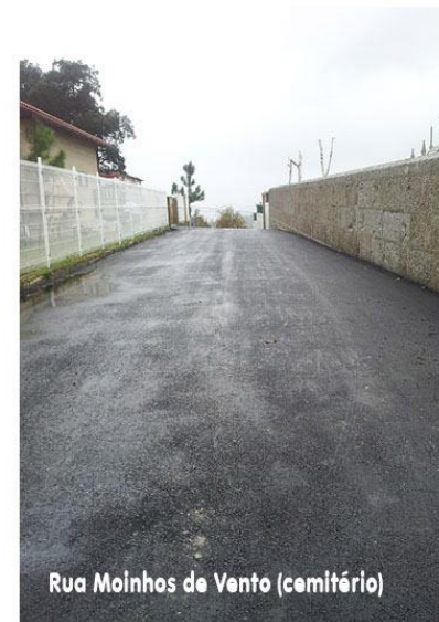
Rua Molinhos de Vento (cemitério)

pavimentação na Rua do Cruzeiro (desde o largo até início subida para o Lugar Novo), uma obra por que nos batemos desde que assumimos funções levando a que a mesma fosse incluída no projecto da pavimentação