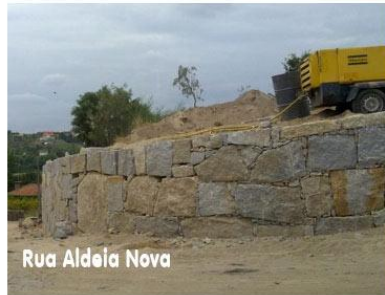
Rua Aldeia Nova

Para todos terem uma ideia e num simples exercício, os 40.500,00 Euros dariam para pavimentar cerca de 4.500 m 2 em paralelos o que nos permitia resolver grande parte dos problemas que ainda possuímos nas várias ruas em terra batida