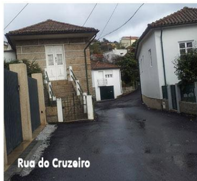
Rua do Cruzeiro

Garanto-vos, que não foi por falta de empenho, dedicação e trabalho que estas e outras obras não foram concretizadas. Todos sabemos os tempos difíceis em que vivemos, as consequências inerentes e os cortes que ocorrem a todos os níveis, como por exemplo: - nestes dois primeiros anos as transferências da Câmara Municipal e do Orçamento de Estado diminuíram em cerca de 40.500,00€ (quarenta mil e quinhentos euros). Da Câmara Municipal, recebemos menos 35.000,00€ e, acreditem