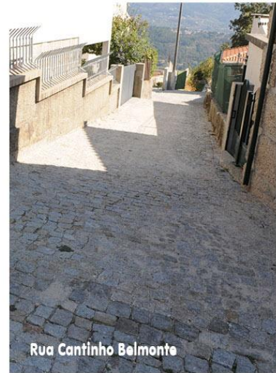
Rua Cantinho Belmonte

pois estaremos a contribuir para crianças mais bem preparadas para o futuro. Os programas culturais que disponibilizamos, como sejam os concertos com Bandas de Música e a apresentação da Peça de Teatro foram iniciativas que traduzem a implementação de uma agenda cultural na nossa gestão. Permitam-me que realce a